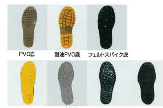
PVC底 耐油PVC底 フェルトスパイク底 多機能PVC底 フェルト底 PVCスパイク底 ラバー底