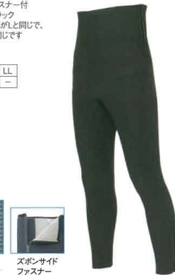
ズボンサイド ファスナー